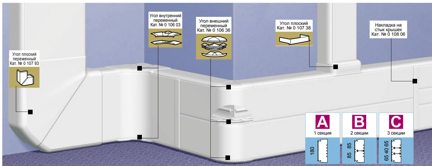
Таблица выбора стр. 708-709 Таблица емкости кабель-каналов стр. 707